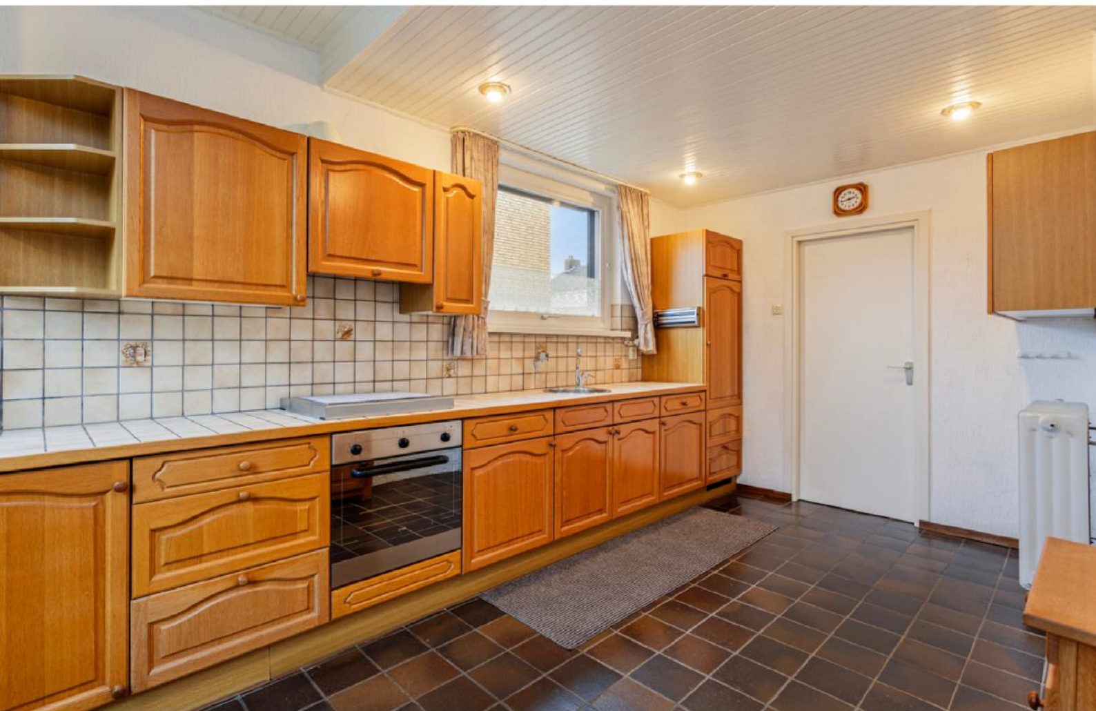
CHURCHILLSTRAAT 3 - KEUKEN